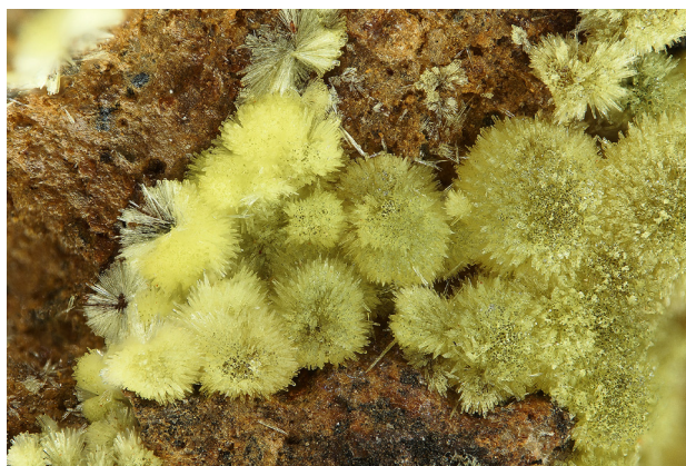
Fig. 5 Long prismatic crystals of čejkaite, \text{Na}_4[(\text{UO}_2)(\text{CO}_3)_3] on the specimen from the Giftkies adit, Unruhe area, Jáchymov (Czech Republic). Horizontal field of view is 6 mm